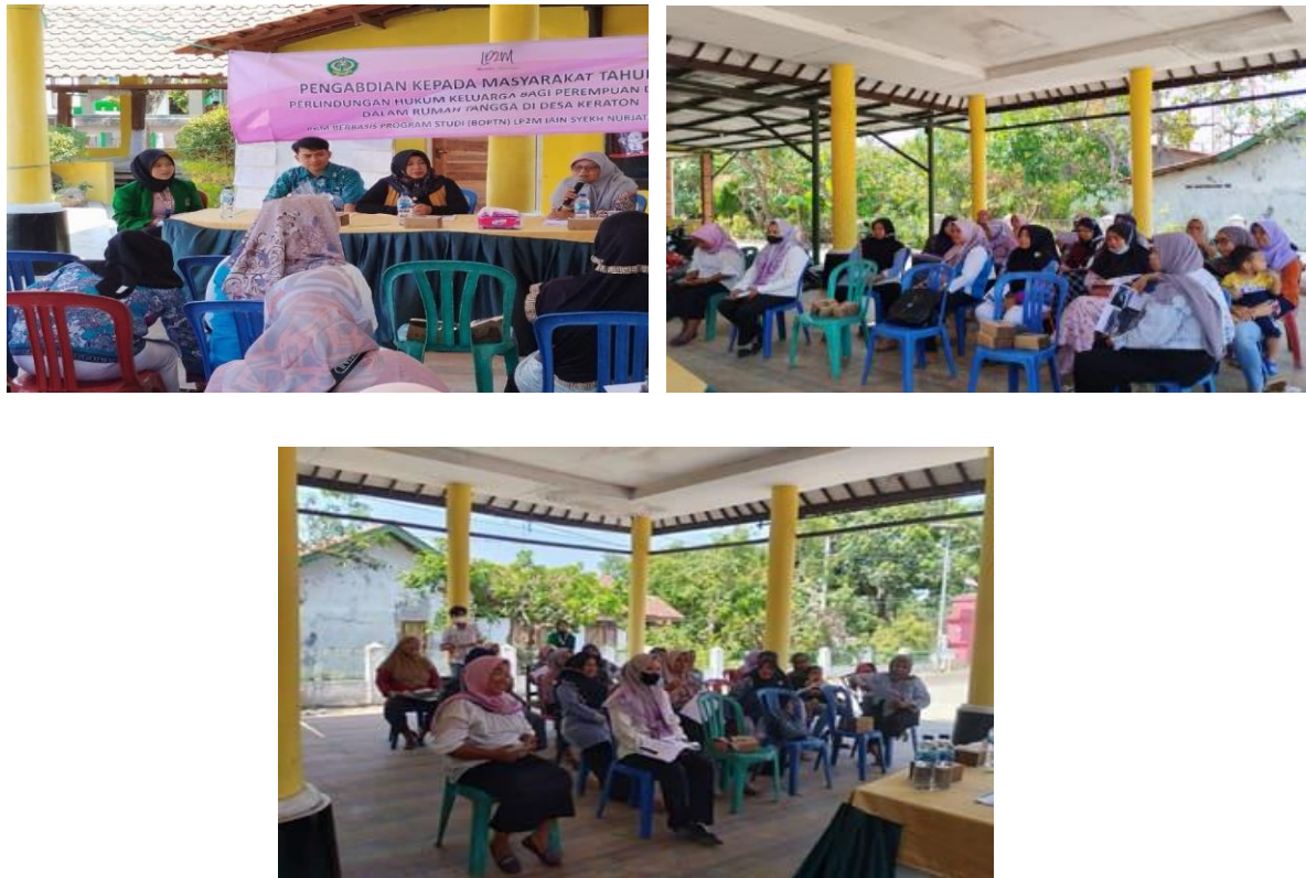
Gambar 4. Dokumentasi Pelaksanaan Pengabdian kepada Masyarakat Desa Keraton

penegak hukum menjadi prasyarat keberlanjutan (Fisher et al., 2023; Tocci et al., 2024; Vann, Rith, & Suyitno, 2025).