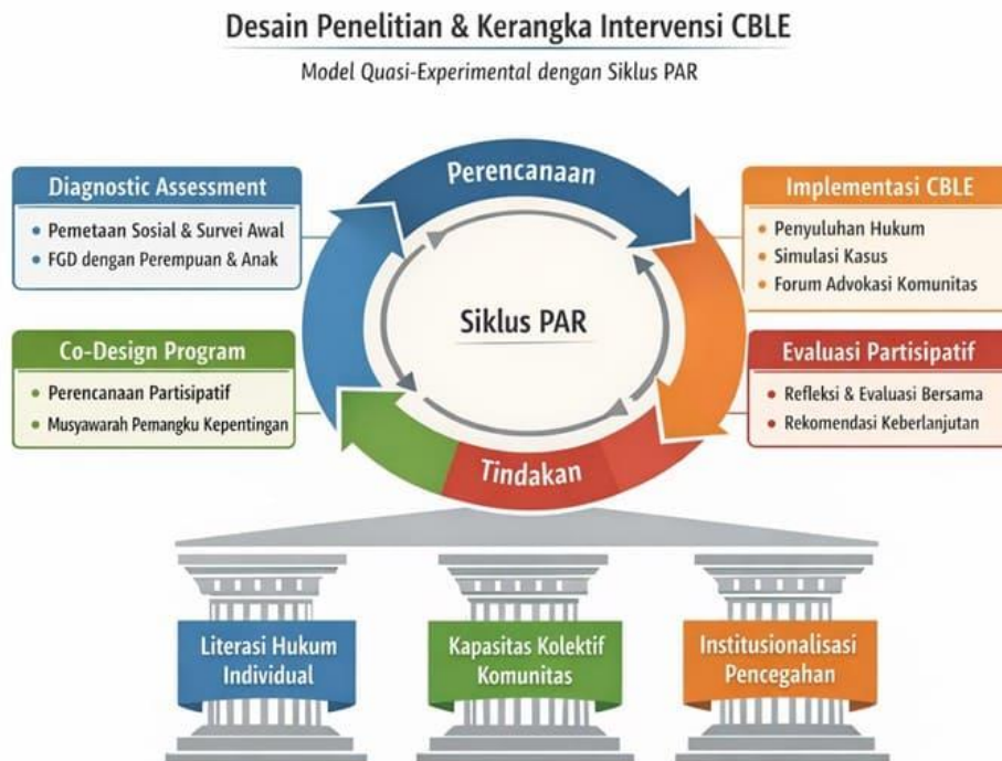
Gambar 3. Desain Penelitian dan Kerangka Intervensi CBLE

tim pengabdian/fasilitator dan pemangku kepentingan desa untuk menilai efektivitas program, mengidentifikasi faktor pendukung maupun penghambat, serta merumuskan strategi keberlanjutan dan pelebagaan praktik baik dalam struktur komunitas (Cornish et al., 2023; Szoko, Slade, et al., 2025; Szoko, Wilson, et al., 2025).