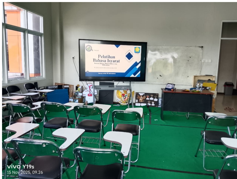
Gambar 2. Pelatihan

Selain itu, peserta juga diberikan pemahaman mengenai hak-hak penyandang disabilitas. Ini sejalan dengan pemaparan (Eka Wulandari et al., 2025) pentingnya kesetaraan dalam interaksi sosial, serta peran masyarakat dalam menciptakan lingkungan yang ramah disabilitas. Dalam sesi diskusi, peserta diberikan kesempatan untuk menyampaikan pertanyaan, pengalaman, serta pandangan mereka terkait interaksi dengan penyandang tuli. Diskusi ini bertujuan untuk menggali persepsi awal peserta serta meningkatkan kesadaran mereka terhadap pentingnya komunikasi inklusif. Melalui kegiatan sosialisasi ini diharapkan peserta memiliki pemahaman awal mengenai keberagaman cara berkomunikasi dalam masyarakat serta tumbuhnya sikap empati dan keterbukaan terhadap penyandang tuli. Tahap sosialisasi ini juga menjadi landasan penting sebelum peserta mengikuti tahap pelatihan bahasa isyarat dasar yang dilaksanakan pada tahap berikutnya.