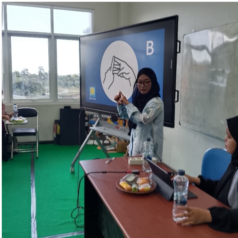
Gambar 2. Dokumentasi Pelatihan

Selanjutnya, pelatihan dilanjutkan dengan pengenalan kosakata dasar dalam bahasa isyarat , seperti salam, perkenalan diri, kata-kata yang berkaitan dengan aktivitas sehari-hari, serta ungkapan sederhana yang sering digunakan dalam percakapan. Materi ini disampaikan melalui metode demonstrasi, latihan berulang, serta permainan edukatif untuk membantu peserta memahami dan mengingat gerakan isyarat dengan lebih mudah. Setelah peserta memahami alfabet dan kosakata dasar, kegiatan dilanjutkan dengan praktik komunikasi sederhana menggunakan bahasa isyarat .