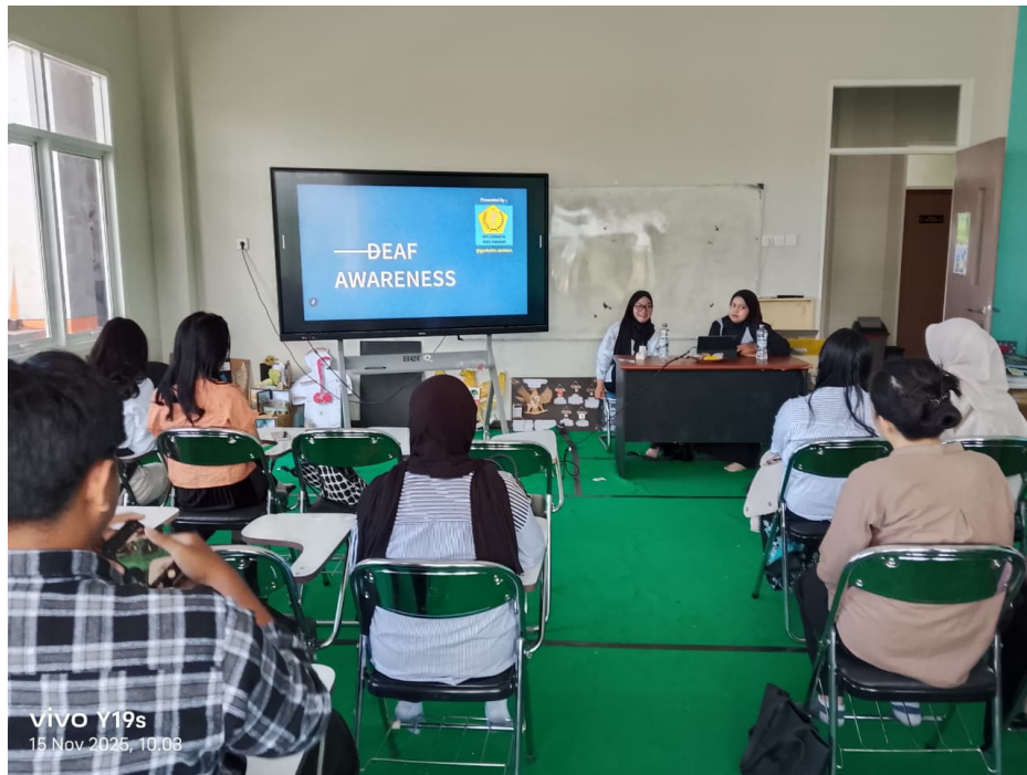
Gambar 4. Acara Pelatihan

Peserta menunjukkan antusiasme yang tinggi selama kegiatan berlangsung. Hal ini terlihat dari partisipasi aktif peserta dalam sesi praktik dan diskusi.