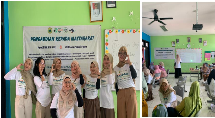
Gambar 1. Tim Pelaksana Pengabdian kepada Masyarakat dan Peserta

Setelah sesi pelatihan terlaksana, peserta diminta untuk mengisi formulir post-test melalui diskusi dan wawancara yang dilakukan sejak berakhirnya sesi pelatihan. Hasil post-test yang telah peneliti terima dilaporkan kepada mitra sebagai bentuk informasi dan saran pengembangan selanjutnya. Evaluasi kegiatan dilakukan menggunakan pre-test dan post-test untuk mengukur keterampilan komunikasi interpersonal orang tua berbasis model HURIER, serta angket kepuasan mitra. Hasil evaluasi menunjukkan adanya peningkatan keterampilan komunikasi interpersonal orang tua setelah mengikuti pelatihan. Secara umum, kegiatan berjalan lancar dan mendapat respons positif dari mitra.