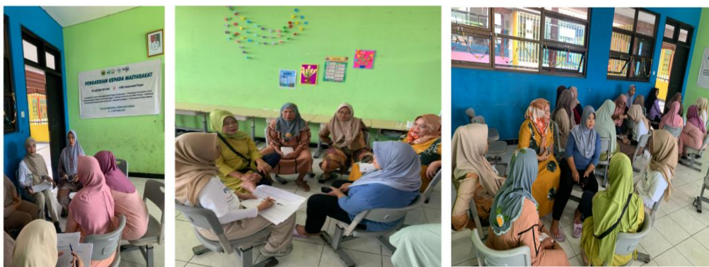
Gambar 2. Proses Kegiatan Pengabdian kepada Masyarakat

Gambar 1. memperlihatkan tim pelaksana dan peserta kegiatan pengabdian kepada masyarakat di SDN 03 Pagi Pulau Panggang, dan Gambar 2. memperlihatkan dan mempraktekan model HURIER dalam proses pelaksanaan kegiatan pengabdian kepada masyarakat. Peserta terlihat cukup antusias selama pelaksanaan kegiatan tersebut.