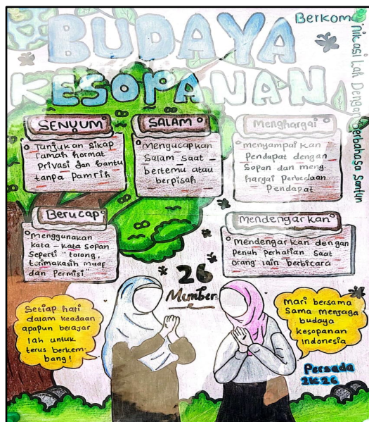
Gambar 5. Barcode Video Pameran karya dan Gambar 6. Poster Edukasi

Sementara itu, untuk menilai tingkat ketercapaian program, evaluasi pelaksanaan dilakukan melalui pemberian angket sebelum dan sesudah kegiatan pembinaan bahasa Indonesia di SMPIT Al-Ridwan. Angket tersebut digunakan untuk mengukur sejauh mana wawasan dan pemahaman peserta terhadap materi yang disampaikan oleh tim pelaksana sehingga diperoleh umpan balik yang terukur sebagai dasar pengembangan dan penyempurnaan program pengabdian di masa mendatang (Bastian dkk., 2025: 950).