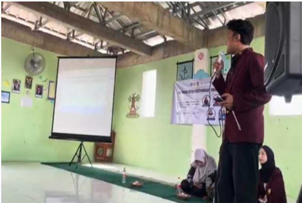
Gambar 7. Pemaparan Materi oleh Narasumber

Kegiatan Pembinaan Literasi Bahasa Indonesia untuk Meningkatkan Kemampuan Komunikasi Siswa SMPIT Al-Ridwan dilaksanakan oleh tim PKM-PM Pendidikan Bahasa dan Sastra Indonesia Universitas Singaperbangsa Karawang bekerja sama dengan SMPIT Al-Ridwan. Kegiatan ini bertujuan untuk menumbuhkan kesadaran siswa dalam menggunakan bahasa Indonesia yang baik dan benar di lingkungan sekolah. Sosialisasi dilaksanakan pada Jumat, 31 Oktober 2025 bertempat di Aula SMPIT Al-Ridwan mulai pukul 06.30 hingga 11.00 WIB. Pelaksanaan kegiatan diawali dengan briefing panitia di kampus, dilanjutkan keberangkatan menuju lokasi, dan persiapan tempat kegiatan. Acara kemudian dibuka dengan doa, menyanyikan lagu Indonesia Raya, serta sambutan dari pihak sekolah dan koordinator acara yang menjelaskan tujuan kegiatan.