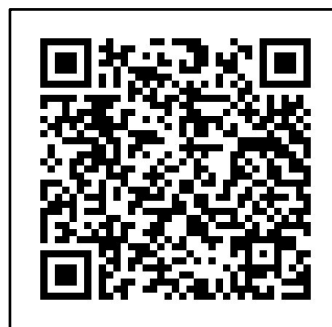
Gambar 4. Barcode E-booklet