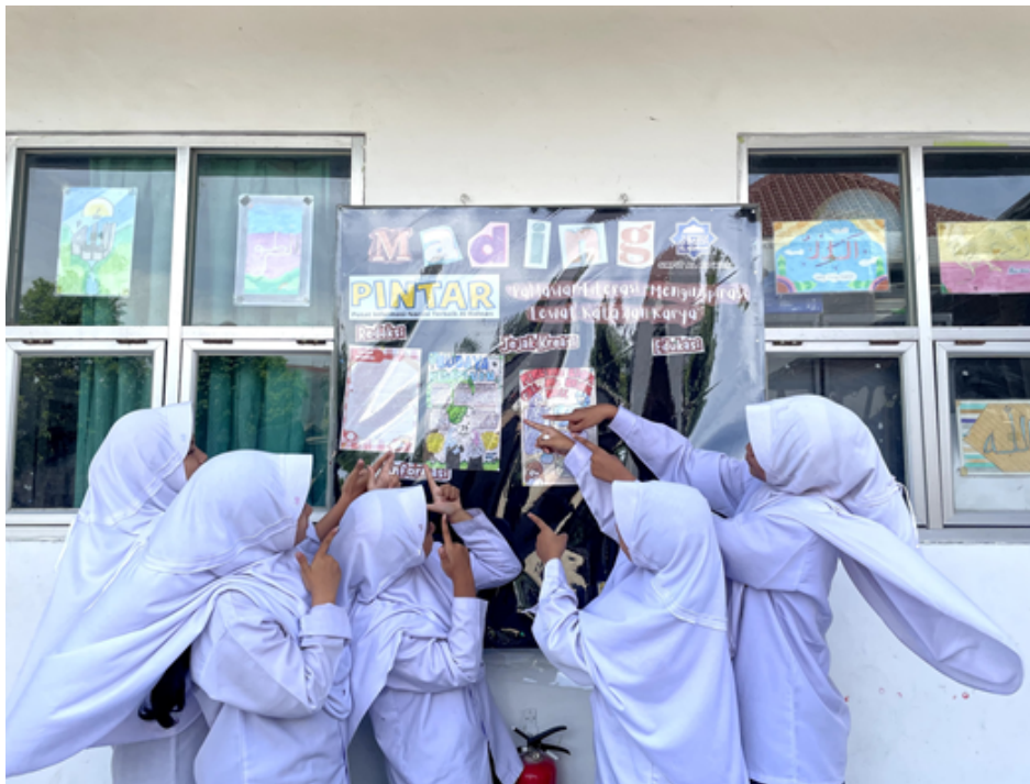
Gambar 9. Pameran Karya Poster Edukasi

Produk dari kegiatan ini berupa poster edukasi dengan tema “Pendidikan mengenai penggunaan bahasa yang tepat di sekolah. Pameran dilaksanakan di mading sekolah dengan sasaran siswa dan mahasiswa menjadi penanggung jawab kegiatan ini. Pembagian tugas dilakukan pada Rabu, 5 November 2025, sementara pameran itu sendiri dilaksanakan pada Senin, 10 November 2025. Setiap kelas membahas tema yang berbeda sesuai dengan tingkat dan kelompok mereka. Kelas 7 untuk siswa perempuan memperbincangkan tentang penggunaan bahasa sopan di sekolah, sedangkan kelas 7 untuk siswa laki-laki memfokuskan diri pada berbahasa santun saat berbicara dengan guru. Kemudian, kelas 8 untuk siswa perempuan membahas perbedaan antara bahasa gaul dan bahasa baku, sementara kelas 8 untuk siswa laki-laki menekankan penggunaan bahasa yang positif dan tidak kasar terhadap teman. Untuk kelas yang lebih tinggi, siswa perempuan kelas 9 membicarakan penggunaan bahasa sopan saat menyampaikan pendapat dan berdiskusi di kelas, sedangkan siswa laki-laki kelas 9 menekankan pentingnya merasa bangga menggunakan bahasa Indonesia yang baik dan benar.