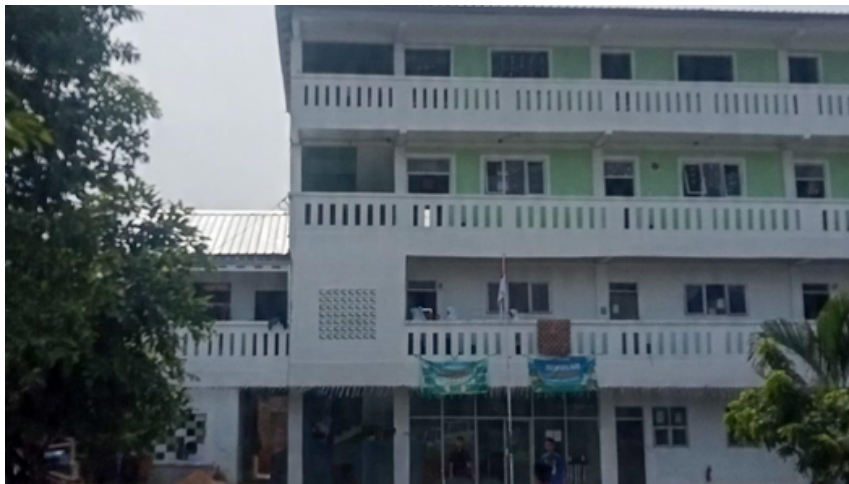
Gambar 1. SMPIT Al-Ridwan

SMPIT AL-Ridwan merupakan sekolah berbasis Islam terpadu yang berkomitmen membentuk peserta didik berkarakter Islami, berilmu, dan berakhlak mulia. SMPIT ini beralamat di Karaba Indah Blok GC.02, Desa Wadas, Kecamatan Telukjambe Timur, Kabupaten Karawang 41361. Jumlah keseluruhan siswa di SMP IT Al-Ridwan sebanyak 135 orang, terdiri atas 34 siswa kelas VII, 43 siswa kelas VIII, dan 58 siswa kelas IX. Kegiatan belajar mengajar berlangsung setiap hari mulai pukul 07.30 sampai 15.00 WIB. Pada pelaksanaannya, sekolah menggabungkan kurikulum nasional dengan nilai-nilai keIslaman yang menekankan pada pembinaan akhlak dan kedisiplinan. Lingkungan sekolah cukup kondusif dan memiliki tenaga pendidik yang berdedikasi tinggi, tetapi masih terdapat beberapa tantangan dalam proses pembelajaran, khususnya dalam hal kemampuan berbahasa Indonesia siswa.