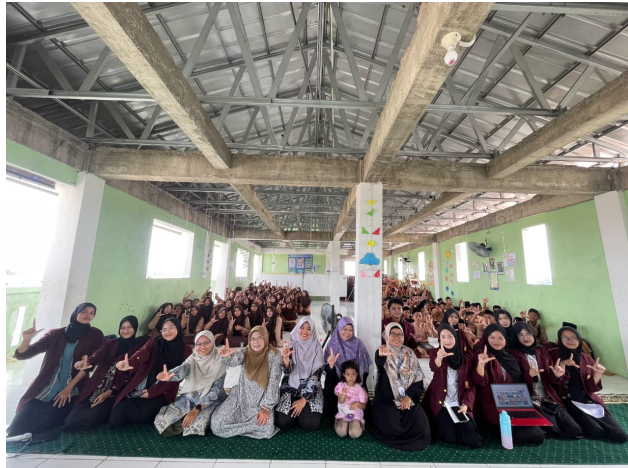
Gambar 2. Dokumentasi Kegiatan Sosialisasi

Adapun materi yang dijelaskan dalam kegiatan sosialisasi meliputi beberapa subbab, yaitu mari bangga berbahasa Indonesia dengan baik dan sopan, mengasah kemampuan berbahasa, menumbuhkan sikap positif terhadap bahasa Indonesia di sekolah, faktor-faktor yang mempengaruhi cara kita berbahasa, pembiasaan dalam penggunaan bahasa Indonesia di sekolah, bentuk pembiasaan yang dapat dilakukan untuk meningkatkan kemampuan komunikasi siswa di sekolah, serta mengurangi kebiasaan penggunaan bahasa daerah (bahasa sunda) dalam konteks komunikasi formal dan akademik di lingkungan sekolah.