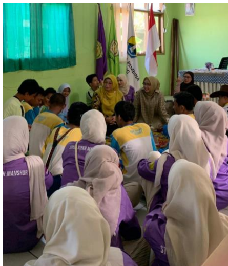
Gambar 1. Read Aloud Oleh Pendamping

Implementasi pojok literasi sebagai bagian dari intervensi memberikan ruang bagi siswa untuk mengakses buku secara mandiri di luar jam pembelajaran (Aryanti et al., 2024; Toews et al., 2021). Guru mencatat bahwa pojok literasi menjadi pusat aktivitas baru, dimana siswa tertarik untuk membaca atau melihat-lihat buku cerita yang tersedia. Pentingnya lingkungan fisik yang mendukung literasi bagi siswa ABK, terutama untuk membangun kebiasaan membaca secara berkelanjutan.