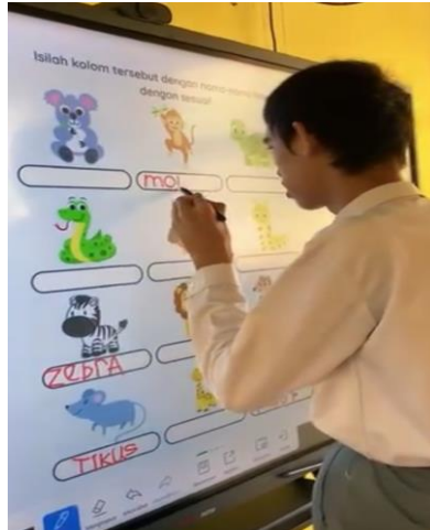
Gambar 2. Pendampingan Literasi Oleh Mahasiswa

keterlibatan multi-stakeholder dalam pendidikan inklusif meningkatkan efektivitas program literasi dan menumbuhkan ekosistem pembelajaran yang suportif.