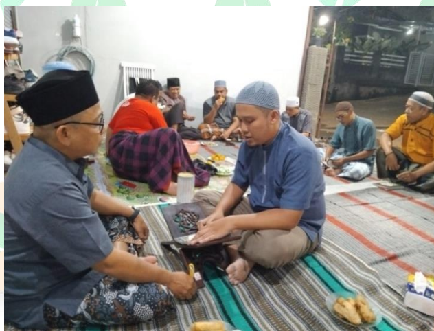
Gambar 3. Pelaksanaan Belajar Membaca Al-Qur'an dengan Teknik Sorogan

Penggunaan teknik sorogan dinilai efektif karena memungkinkan pengajar memberikan perhatian sesuai dengan kemampuan masing-masing peserta. Teknik ini juga memperkuat interaksi antara pengajar dan peserta sehingga tercipta suasana belajar yang lebih personal, nyaman, dan kondusif. Tradisi sorogan sendiri telah lama digunakan di pesantren dan terbukti efektif dalam pembelajaran Al-Qur'an karena memungkinkan pembinaan secara individual sekaligus membangun kedekatan antara guru dan murid (Dhofier, 1982; Nata, 2001).