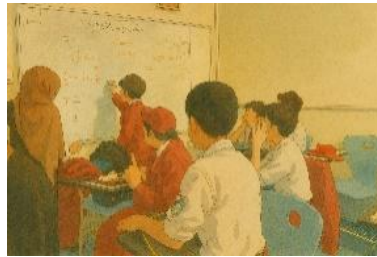
Gambar 5: Suasana Pembelajaran di dalam kelas