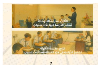
Gambar 9: Perbaikan Teks