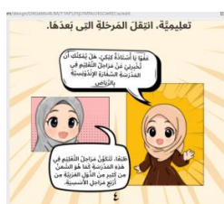
Gambar 8: Perbaikan Teks

Kedua , ahli materi memberikan catatan revisi perbaikan teks pada beberapa bagian seperti dibawah ini: