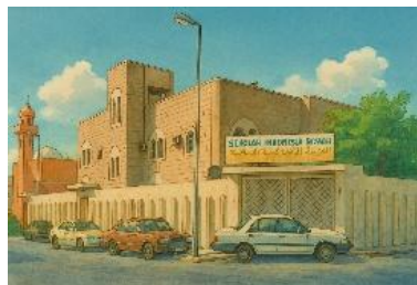
Gambar 6: Gambar Sekolah Indonesia Riyadh