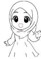
Gambar 2: Desain Karakter Maryam