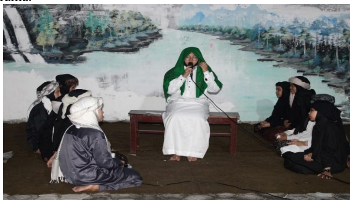
Gambar 1 Implementasi Drama Pendek

Sementara itu, fokus pembelajaran santri kelas 1 hingga 3 diarahkan pada penguasaan kosakata dasar melalui kegiatan hafalan dan praktik berbicara sederhana. Oleh karena itu, santri pada jenjang ini diarahkan untuk membangun kemampuan komunikasi dasar sebelum terlibat dalam aktivitas drama.