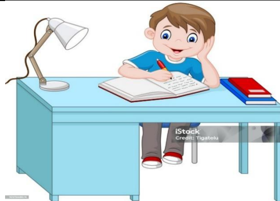
Gambar 2. Menulis Cerita

جلس تلميذٌ مُجتهدٌ على الكرسيِّ أمامَ المكتبِ، أمامَه كتابٌ ودفتَرٌ، وفي يده قلمٌ. يكتبُ الدرسَ بنشاطٍ ويتعلَّمُ جيِّدًا. يضيءُ المِصباحُ المكتبَ، فيستطيعُ التلميذُ أن يدرسَ براحةٍ. هذا التلميذُ يُحِبُّ العِلْمَ ويسعى إلى النَّجاحِ