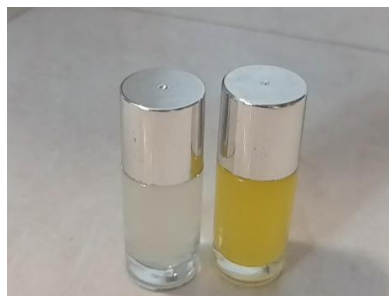
Gambar 1. Hasil formulasi parfum dari kulit jeruk manis dan jeruk nipis

Secara visual, kedua parfum menunjukkan perbedaan warna. Parfum dari kulit jeruk manis memiliki warna kuning kecoklatan, sedangkan parfum dari kulit jeruk nipis memiliki warna kuning bening. Perbedaan tampilan visual tersebut dapat diamati pada Gambar 1.